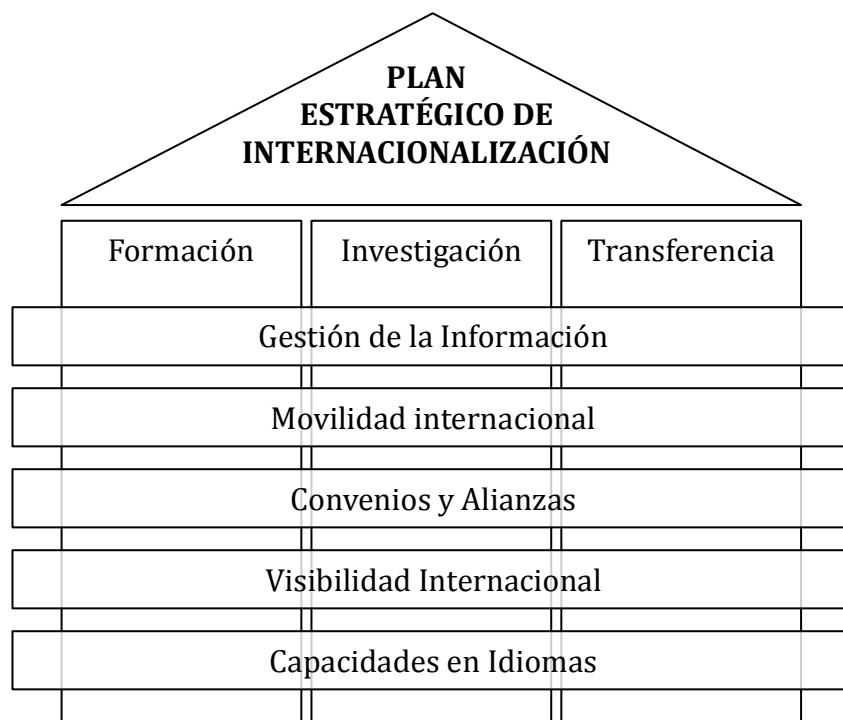
Figura 3: Plan estratégico de Internacionalización de la Universidad de Sevilla

De acuerdo con los planteamientos anteriores, el plan estratégico de internacionalización de la Universidad de Sevilla se estructura en forma matricial, integrado por ocho grandes líneas de actuación: tres de naturaleza vertical y cinco de tipo trasversal. Las líneas verticales hacen referencia a las tres grandes funciones que desempeña la universidad en la actualidad, (a) la formación, (b) la investigación y (c) la transferencia de conocimiento dentro del sistema de I+D+i. Por su parte, estas tres áreas fundamentales requieren de un conjunto de medidas de apoyo continuo que configuran las líneas transversales. Estas cinco líneas hacen referencia a (1) la creación de un sistema de gestión de la información para la internacionalización, (2) la potenciación de la movilidad internacional, (3) la gestión de convenios y alianzas estratégicas internacionales, (4) la mejora de la visibilidad y reputación internacional de la Universidad de Sevilla y (5) la mejora de las capacidades interculturales y en idiomas por parte de toda la comunidad universitaria (ver figura 3).